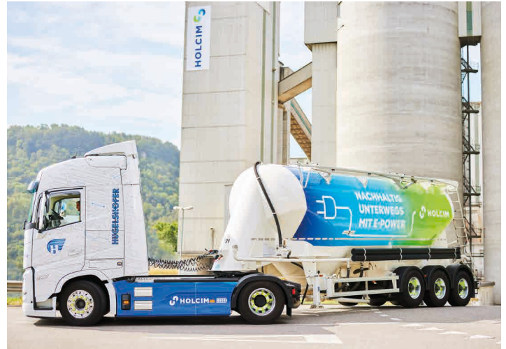
Ein Drittel der Zement-Transporte ab Siggenthal erfolgt per E-LKW.

Zudem sind weitere, neue Zementprodukte in Planung. Denn das Werk in Siggenthal geht mit seinen vier führenden Forschungslaboren voran und engagiert sich für eine nachhaltige und umweltorientierte Entwicklung von Baustofflösungen.