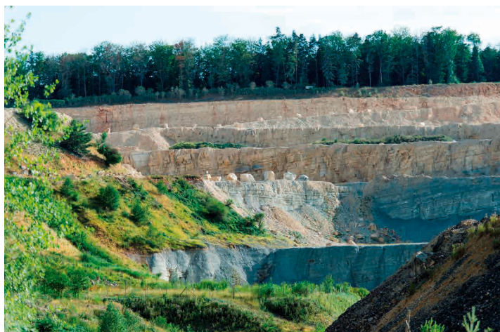
Steinbruch Gabenchopf, Zementwerk Siggenthal

2019 erhielt Holcim von der Gemeinde Villigen die Bewilligung zur Erweiterung des Steinbruchs, nachdem die Bevölkerung, der Kanton und die Gemeinde dem Vorhaben zugestimmt hatten. Damit ist die Rohstoffversorgung des Werks bis etwa 2030 sichergestellt. Um den kantonalen und nationalen Bedarf an Zementrohstoffen nach 2030 abzudecken, beabsichtigen wir, den Steinbruch Gabenchopf zu erweitern.