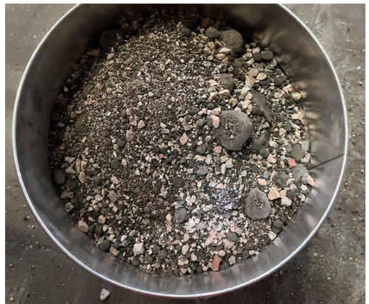
Mischgranulat - rezyklierte Gesteinskörnung für die Zementproduktion