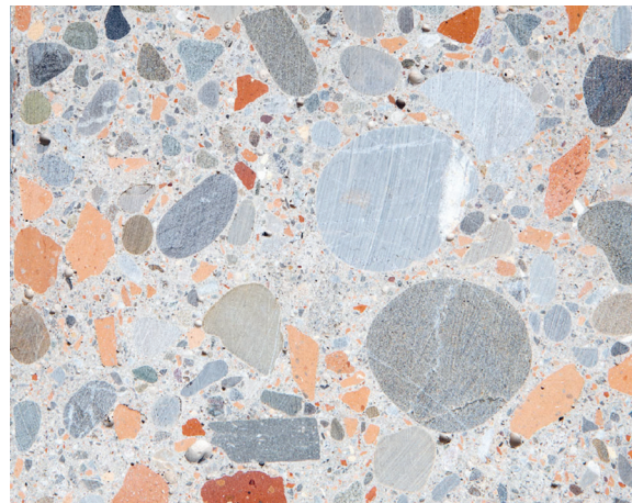
Beton mit rezyklierter Gesteinskörnung

Beton darf als Beton nach Eigenschaften zusätzlich zur natürlichen Gesteinskörnung weniger als 25 Massenprozent Betongranulat C oder weniger als 10 Massenprozent Mischgranulat M enthalten, sofern die rezyklierte Gesteinskörnung bei der Erstprüfung bereits berücksichtigt wurde und von diesem Beton Konformitätsnachweise vorliegen.