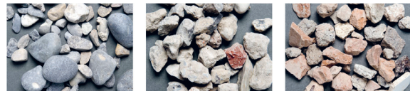
Abbildung 1: Gesteinskörnungen für Beton (links: natürliche, gerundete Gesteinskörnung, Mitte: Betongranulat, rechts: Mischgranulat).