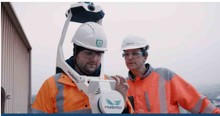
Unser Werk hat einen digitalen Zwilling

IM SEPTEMBER FEIERT DAS ZEMENTWERKS SIGGENTHAL SEIN 110. JUBILÄUM: WIR BLICKEN IN DIE VERGANGENHEIT UND ZUKUNFT