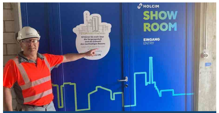
Im Herzstück des Zementwerks ist ein Showroom eingezogen