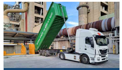
Verwertungsverfahren für Strassensammler- schlämme schont Ressourcen