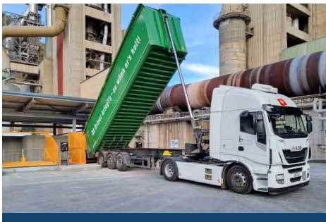
Annahme von Strassensammlerschlämmen